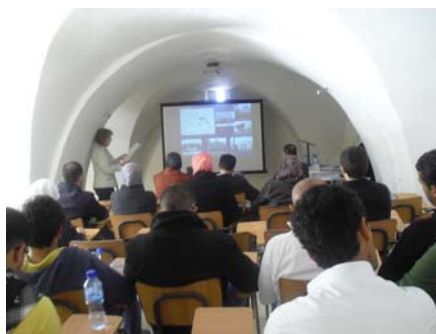
Conférence au CURP à An-Najah University, Naplouse, 2013